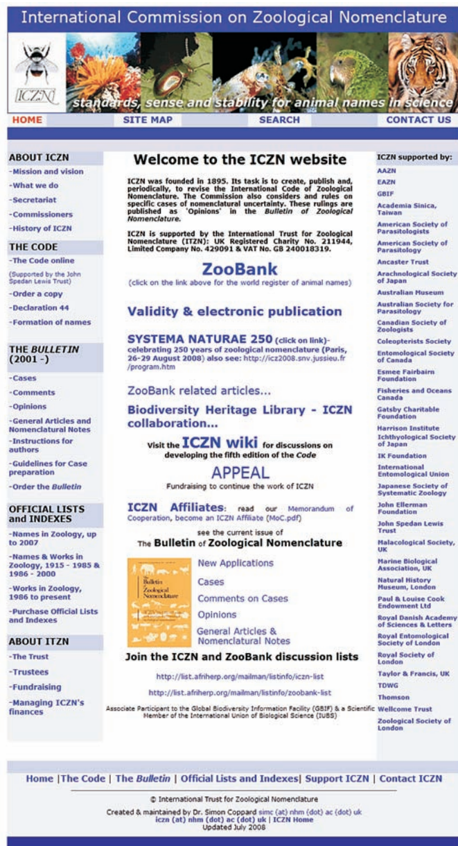
Abb. 3: Begrüßungsseite der Website ( http://www.iczn.org/ ) der Internationalen Nomenklaturkommission (ICZN). Hier sind viele wichtige Informationen über die Zoologische Nomenklatur abrufbar.