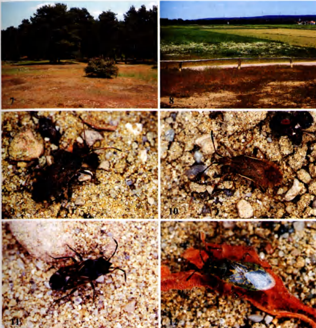
Abb. 7: Der Alzenauer Sand im Untermaingebiet gehört trotz seiner heute nur mehr geringen Größe zu den wertvollsten Lebensräumen für Landwanzen. Hier konnten im Rahmen der GEO-Tage im Jahr 2004 bei nur einer Sammelexkursion 51 Arten von Landwanzen gefunden werden, darunter ausgesprochene Kostbarkeiten der bayerischen Wanzenfauna.

Abb. 8: Als besonders wertvoll zeigte sich ein unmittelbar an das NSG grenzender Ackerrandstreifen mit lückig bewachsenen Lockersanden. Hier wurden u. a. Arenocoris waltli , Arenocoris falleni , Ceraleptus gracilicornis , Ceraleptus lividus , Sehirus morio , Geocoris ater , Eurydema ornatum , Megalonotus praetextatus , Peritrechus lundii und Rhopalus tigrinus nachgewiesen.