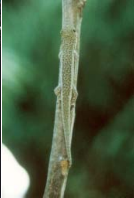
Abb. 3. Lebensraum von Phelsuma kely sp. nov.; die Art bevorzugt vor allem die Strauchvegetation.

Habitat of Phelsuma kely sp. nov., the species prefers shrubs.