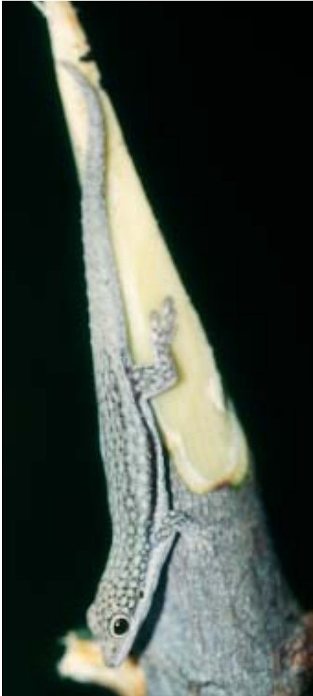
Abb. 1. Dorsale Ansicht des Tieres von Abb. 2. im Lebensraum. – Foto: P. SCHÖNECKER.

Färbung: Die Färbung des konservierten Holotypus ist mit der Lebendfärbung von im Freiland fotografierten Tieren (Abb. 1 u. 2) nahezu identisch, aber deutlich dunkler. Die Art verfügt über die Fähigkeit, ihre Färbung extrem abzudunkeln und dann dorsal nur noch dunkelgrau bis schwarz zu erscheinen. Der ganze Körper besitzt in Aktivitätsfärbung eine weißlich graue Grundfarbe, die auf dem Kopf bis zum Oberrand der Ohröffnung reicht. In dieser Grundfarbe findet sich eingestreut ein feines, schwarzes Muster, das sich als breites Dorsalband bis zum Schwanz erstreckt. Jeweils seitlich davon befindet sich ein graues Band mit eingestreuten weißen Flecken. An den