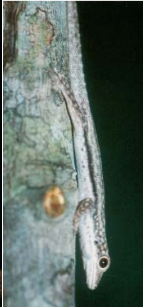
Abb. 2. Laterale Ansicht von Phelsuma kely sp. nov., eines der untersuchten Tiere im Lebensraum.

Dorsal view of P. kely sp. nov. in its habitat.