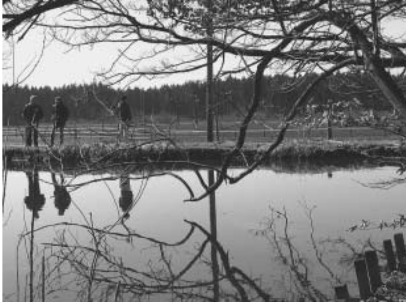
Abb. 2: Westteil des Warnberger Weihers (ca. 1000 m 2 ; 579 m NN) am Kloster Warnberg (München-Solln) im Bereich eines isolierten Lehmhügels (ehemaliger Ziegelstadel) in der südlichen Münchner Schotterebene. Erstmals nachweis von Rana dalmatina (Laichballen am 7.4.2010) im Stadtgebiet. Gleichzeitig Laichplatz von mehreren hundert Erdkröten. Das Gewässer ist zeitweilig stark verschmutzt (Entenfütterung). Blickrichtung nach Südwest mit angrenzenden Pferdekoppeln, Ackerflächen und der Silhouette des 500 m entfernten Forstenrieder Parks.

Western part of the »Warnberger Weiher« (about 1000 m 2 ; 579 m a. s. l.) at the monastery Warnberg (Munich-Solln) situated in a former clay pit in the southern Munich gravel plain. First record of Rana dalmatina (spawn on April 4, 2010) within the city of Munich. Also spawning site of some hundred Bufo bufo . The pond is temporarily heavily polluted (feeding of ducks). Viewing direction to southwest with paddocks, farm land and the sky line of the Forstenrieder Park, 500 m distant.