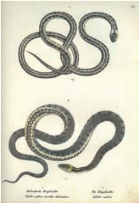
Abb. 9. Frühe Darstellung der geographischen Variation bei der Ringelnatter aus SCHINZ (1833). Oben: Ikonotypus der „Dalmatischen Ringelnatter, Coluber natrix varietas dalmatina “ (systematischer Status unklar). Unten: „Die Ringelnatter, Coluber natrix “ (heute: Natrix natrix helvetica ). Handkolorierte Lithographie.

Early illustration of geographic variation in grass snakes from SCHINZ (1833). Above: Iconotype of the “Dalmatische Ringelnatter, Coluber natrix varietas dalmatina ” (systematical status unclear). Below: “Die Ringelnatter, Coluber natrix “ (nowadays: Natrix natrix helvetica ). Handcoloured lithography.