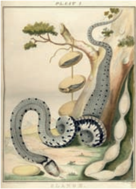
Abb. 5. Fortschrittliche Darstellung einer niederländischen Barren-Ringelnatter bei van LIER (1781). Beschuppung und Pileusbeschilderung sind schon (fast) perfekt. Ein Novum für die Zeit ist die einerseits dekorative, andererseits naturalistische Darstellung fortpflanzungsbiologischer Details mit Schlüpflingen in geöffneten Eiern und einem Gelege. Handkolorierter Kupferstich.

Modern figure of a Dutch Natrix natrix helvetica in van LIER (1781). Pholidosis and the scalation of the top of the head are (almost) perfect. A novelty for that time is the illustration – decorative on one hand, but then naturalistic – of the reproduction biology with hatchlings in opened eggs and a clutch. Hand-coloured engraving.