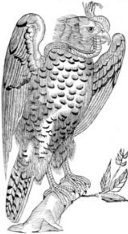
Abb. 1. Falke und Viper aus GESSNER (1669). Holzschnitt.

Falcon and viper from GESSNER 1669 (woodcut).