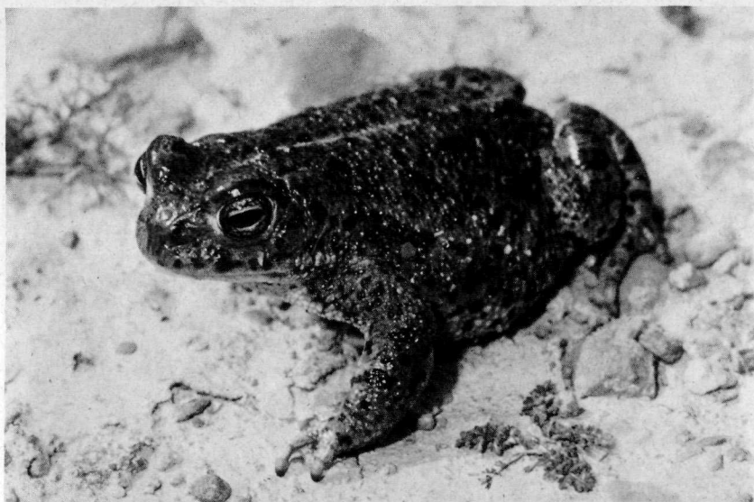
Abb. 14: Kreuzkröte ( Bufo c. calamita ); charakteristisch ist der helle Rückenstreifen.

In Ausnahmefällen reicht keines dieser Merkmale aus, um die Tiere eindeutig zu bestimmen. Solche Tiere treten insbesondere dort auf, wo mehrere Krötenarten vergesellschaftet vorkommen; hier kann es zu natürlichen Hybridisierungen kommen. Derartige Hybriden sind für Kreuz- und Wechselkröte sowie für Erd- und Wechselkröte beschrieben worden. In einer Abgrabung bei Merheim fanden wir 1988 eine solche Kreuzung zwischen Erdkröte und Wechselkröte.