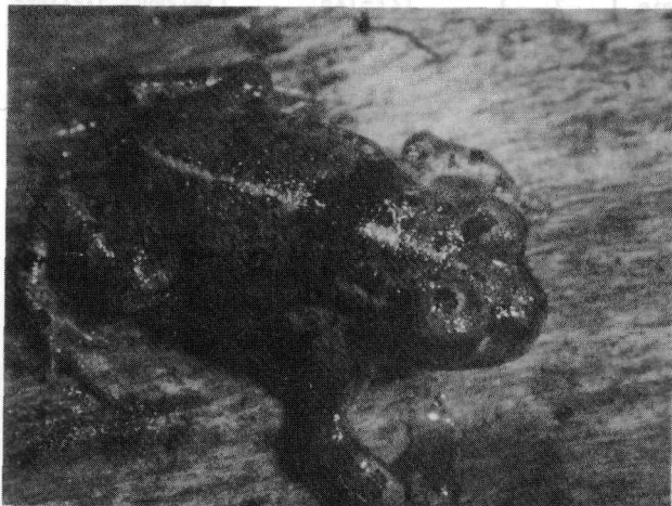
Abb. 1: Juvenile Kreuz- kröte mit schwar- zem Flecken.