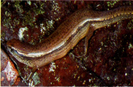
Abb. 1. Amphiglossus melanopleura , trächtiges Weibchen aus An'Ála (bei Andasibe) gravid female from An'Ála (near Andasibe).

Am 20.12.1994 fingen wir bei An'Ala (Umgebung von Andasibe) im primären Regenwald ein trächtiges Weibchen von A. melanopleura , das tagsüber in der Laubstreu aktiv war (Abb. 1). Das Tier, das im Zoologischen Forschungsinstitut und Museum Alexander Koenig (Bonn) unter der Sammlungs-